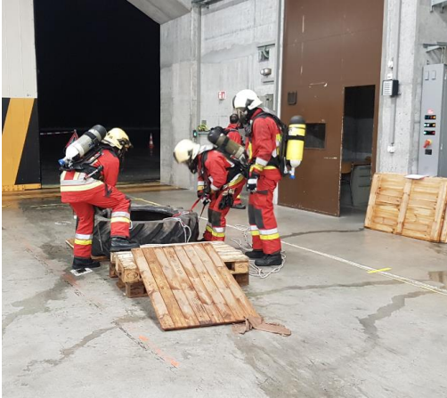
Atemschutzübung unter erschwerten Bedingungen

Insgesamt wurden 38 Übungen absolviert. Die einzelnen Lektionen wurden von den Gruppenführern und Offizieren interessant gestaltet. Die Gestaltung von Plakaten und die Teilnahme an den Übungen hat sich deutlich verbessert. Inhaltlich konnten die Lektionen noch verbessert werden. Ich durfte viele interessante Übungen in allen Abteilungen der FW Wilderswil beobachten. Ich möchte hier allen Offizieren und Gruppenführer herzlich für ihre Engagement danken.