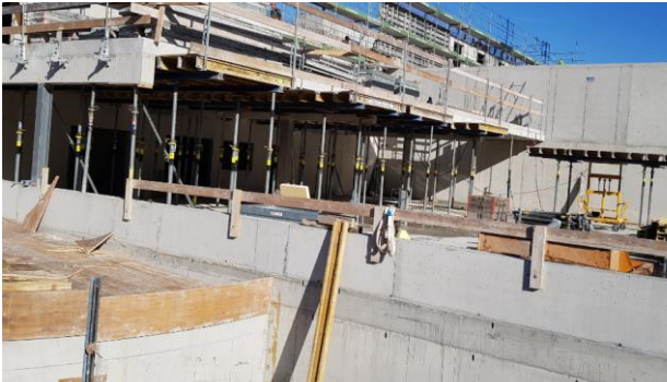
Fahrzeughalle / Bühne

Nun kommen wir dem Ziel für den Bezug des neuen Feuerwehrmagazin deutlich näher. Voraussichtlich werden wir Ende Juni in unser neues Zuhause einziehen. Der Rohbau ist bald fertiggestellt. Nun wird uns im Frühling sicher noch der Einbau der Infrastruktur beschäftigen.