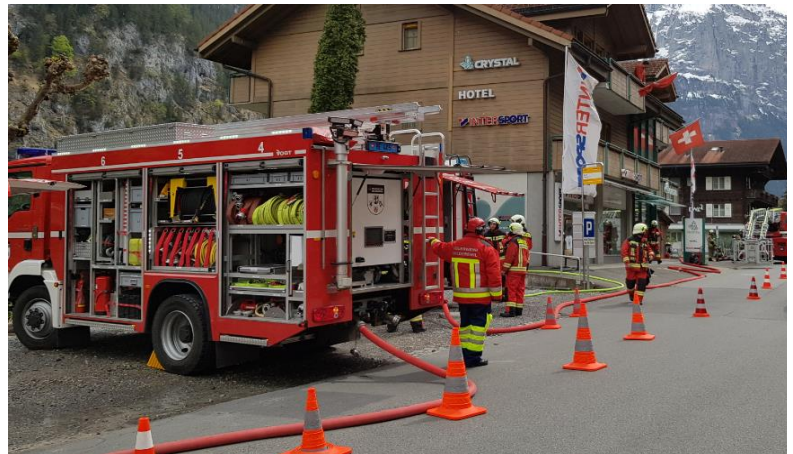
Einsatzübung zusammen mit der FW Lauterbrunnen in Lauterbrunnen. Die Devise «In Krisen Köpfe kennen!»