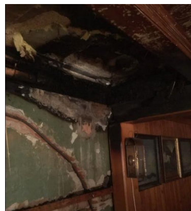
Brand Kirchgasse 29