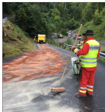
Ölspur in der Saxetenstrasse