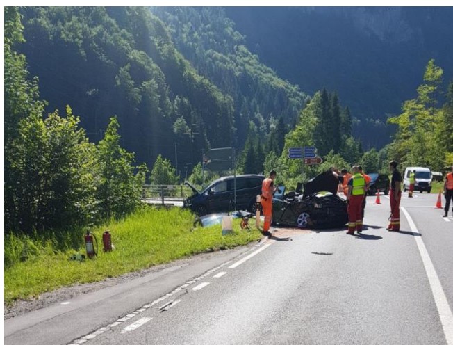
Verkehrsunfall Kreuzung Zweilütschinen